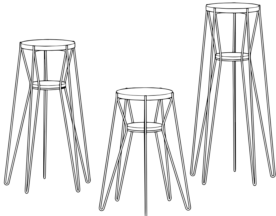
Familia de maceteros Mycan. Mycan65, Mycan50, Mycan80

Macetas muy pesadas y plantas altas pueden subir mucho el centro de gravedad del macetero volviéndolo inestable. No recomendamos hacer esto, si alguien patea o se recarga sobre el macetero podría tirarlo.